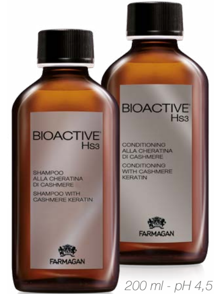
200 ml - pH 5,5 Ref. 2002

Specific conditioner for hair treated with BIOACTIVE HS3 POLYVALENT FLUID. Must be left on the hair for a few minutes, then rinsed with care, it leaves new cashmere keratin, thus increasing elasticity and natural softness of hair.