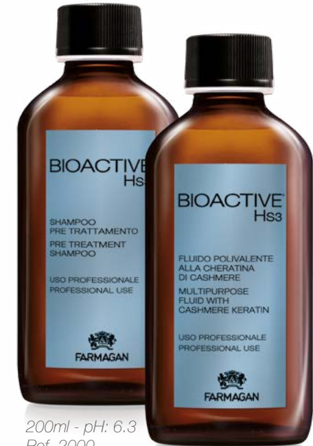
200ml - pH: 6.3 Ref. 2000

Specific fluid for hair with cashmere Keratin that doesn't alter the natural hair structure and that can be used as a regenerator, as an energizer of the curl and modulator of shape or as a discipliner.